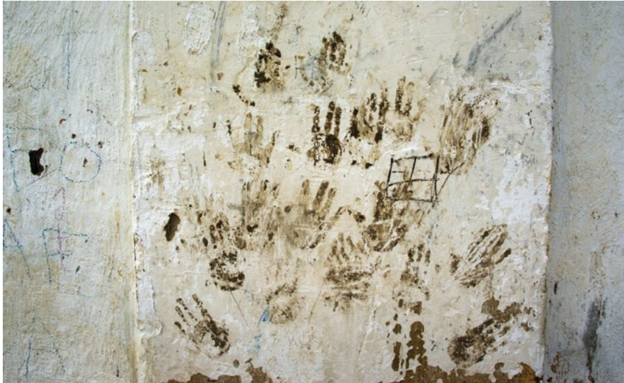
Պատկեր 1. Նեյլի Շիշմանյան. հայ և ադրբեջանցի երեխաների ձեռքերի հետքերը՝ Վրաստանի Շոփի գյուղի Մշակույթի տան պատին

վայրերը, որտեղ հայերն ու ադրբեջանցիներն անցյալում միասին էին ապրում: Նեյլին եղավ Տավուշի և Արարատի մարզերում, Ահմադն ու Ֆամիլը՝ Ադրբեջանի Շամախիի և Աղդամի շրջաններում: Հետո միասին այցելեցին Վրաստանի Շոփի և Խոժորնի գյուղերը: